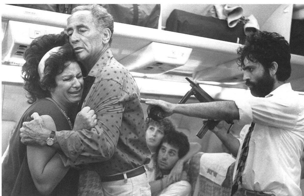
«Delta Force» (USA 1985) von Menahem Golan

Einer der erfolgreichsten anti-arabischen Filme war «Iron Eagle» (1985) von Sidney J. Furie, auch wegen seiner perfiden Vermischung aus Familienroman und Kriegsertüchtigung gegen Lybien. Mit Tina Turner im Kopfhörer und dem bei Videogames erworbenen skill