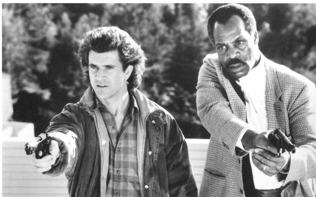
« Lethal Weapon » (USA 1986) von Richard Donner

Heldin einmal mehr gewaltig im Reich des Bösen ebenso wie in « Final Assignment » (1980, Paul Almond), wo die gefährliche Liebesgeschichte einer kanadischen Reporterin mit einem sowjetischen Funktionär in Moskau Anlass ist, alle nur erdenklichen Missstände dort gegen alle nur erdenklichen Errungenschaften hier auszuspielen. In finstere, nicht näher definierte «osteuropäische» Länder führen Filme wie « The Zone 99 » (1995, Barry Zetlin), wo es – natürlich – um eine neue Mafia, den Diebstahl von atomwaffenfähigem Nuklear-Material und hübsche