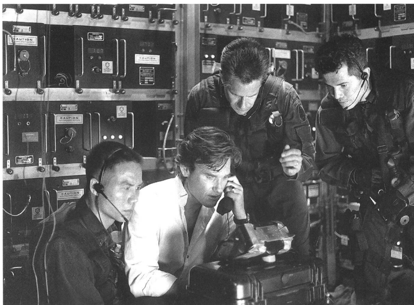
«Executive Decision» (USA 1996) von Stuart Baird

ist unverkennbar und eindeutig das Böse, er ist vollkommen nicht-amerikanisch. Der Kommunist dagegen ist von ganz anderem Kaliber; er schleicht sich ins Land, verwirrt die Nachbarschaften und Kleinstädte, ist der wahre body snatcher und Infiltrator. Der Vietkong ist der verschwindende Feind und Vietnam ist die höllische Wiederkehr des paradiesischen Landes. Hierhin zurück, die Niederlage in einen Sieg zu verwandeln, kann nur der gestählte, einsame Mann als Kampfmaschine. Der arabische Terrorist aber bedroht vor allem die amerikanische