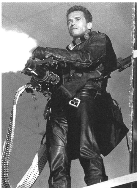
«Terminator 2 – Judgement Day» (USA 1990) von James Cameron

Der Mythos (der Feind ist Teil meines virtuellen Selbstfindungsprozesses), die Ideologie (der Feind ist die Abbildung dessen, was unserem Glück entgegensteht und was für meine Kränkungen verantwortlich ist) steht nun als drittes die ikonographische Konvention gegenüber (der Feind ist das, was sich als Bild gelöst hat und zur semiologischen Gewohnheit geworden ist – das Bild des Feindes ist die Imitation des Feindbildes, das in einem anderen Film schon funktioniert hat). So wie man überrascht sein kann, mit welcher Unverfrorenheit die populäre Kultur nationale Stereotypen zu ikonographischen Konventionen reduziert, so kann man mehr noch überrascht sein, wenn diese Stereotypen das eine oder andere Mal aufkompatible Wirklichkeiten treffen. Und schliesslich kommt als viertes Element in der Konstruktion des Feindbildes die dramaturgische Me-