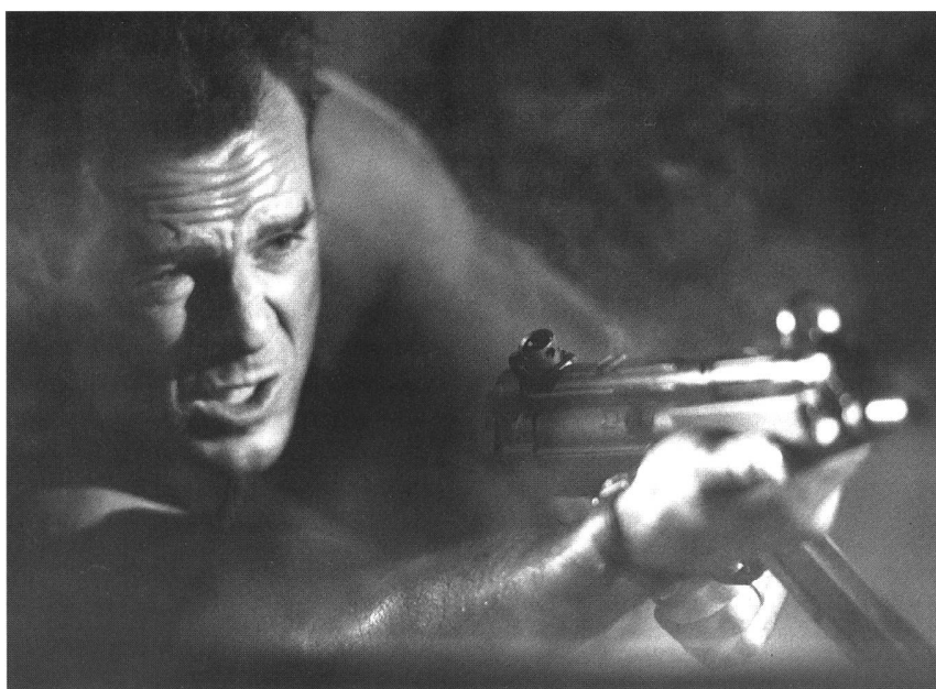
«Die Hard» (USA 1987) von John McTiernan

In « Executive Decision » (1996, Stuart Baird) wird ein Flugzeug unterwegs von Athen nach Washington von islamischen Terroristen gekidnappt, die die Freilassung