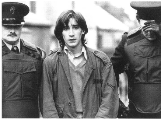
«Cal» (1984) von Pat O'Connor

Dramen mit universellem Charakter, die überall auf der Welt spielen können – in Belfast, Beirut oder South Central – wo Herrschende durch Unterdrückung an der Macht bleiben wollen. Dieser eindeutige Standpunkt bildet die grosse Stärke aber auch die Schwäche des Tandems George/Sheridan. Gerade die politische Situation der Zersplitterung in Nordirland – etwa die Divergenzen zwischen Sinn Fein und der IRA in der Frage des Gewaltverzichts, die unübersichtliche Lage im Lager der Unionisten, die widersprüchlichen politischen Signale aus Dublin und London – zeigt, dass Stellungnahme nicht einfach durch emotionale Betroffenheit ersetzt werden kann. Die Situation ist sehr viel schwieriger und komplexer als die Parteilichkeit der beiden Regisseure vermuten lässt. Trotzdem sind die beiden Filme wichtige Zeichen der Solidarität für die Sorgen, die Ängste und die Verzweiflung der nordirischen Bevölkerung.