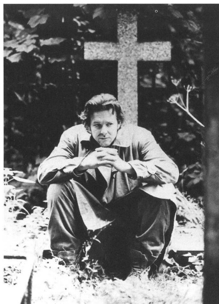
« A Prayer for the Dying » (1987) von Mike Hodges

und die politische Überzeugung des Terroristen verloren hat. Durch den tragischen Tod von Schulkindern bei einem Attentat der IRA wird Fallon aufgeschreckt. Genug ist genug. Jetzt will er mit dem Töten aufhören. Er setzt sich deshalb nach London ab und lässt sich in eine Sehnsucht nach dem Tode treiben. Hodges inszeniert diesen Thriller eigenwillig als vielschichtiges Geschehen. Allerdings geht es ihm nicht um die Ausleuchtung des historischen, religiösen oder politischen Hintergrundes des Konflikts. Er konzentriert sich ganz auf die Figuren, ihr Innenleben und die Verstrickungen, durch die sie in den Teufelskreis der Gewalt und des