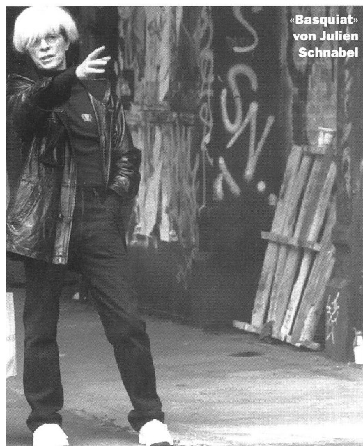
«Basquiat» von Julian Schnabel

Ebenfalls an einer realen Figur orientiert sich Neil Jordan in seinem Film « Michael Collins ». Allerdings an einer, die nicht wie Basquiat zur jüngeren Vergangenheit, sondern zur Historie zu zählen ist. Collins war anfangs des Jahrhunderts einer der Protagonisten des irischen Unabhängigkeitskampfes, welchen der Regisseur geschickt personifiziert. Mag da aber noch soviel Ambition und guter Wille zur Geschichtskorrektur Pate gestanden haben, Jordans Film ist letztlich, was die Spaltung Irlands betrifft, nur bedingt aufschlussreich. Collins, gespielt von Liam Neeson, zieht alle Register gegen die Engländer, ist so unverfroren wie mutig. Scharmützel und andere tragisch-blutige Ereignisse jagen sich in gewohnter Manier amerikanischer grosser Kinokisten, alles ist hochdramatisch aufbereitet. So bleibt wenig Raum zu zeigen, wie ein verzwickter Zwist in den Zwanzigern zur Teilung der Insel geführt hat: Hintergründe ertrinken in vordergründigem Spektakel, in durchgestylten graublauen Bildern. Mag man das bei Filmen, die historische Stoffe erzählen, gemeinhin hinnehmen, ärgert man sich hier darüber, weil die Geschichte in der Realität nicht abgeschlossen ist, der Konflikt ►