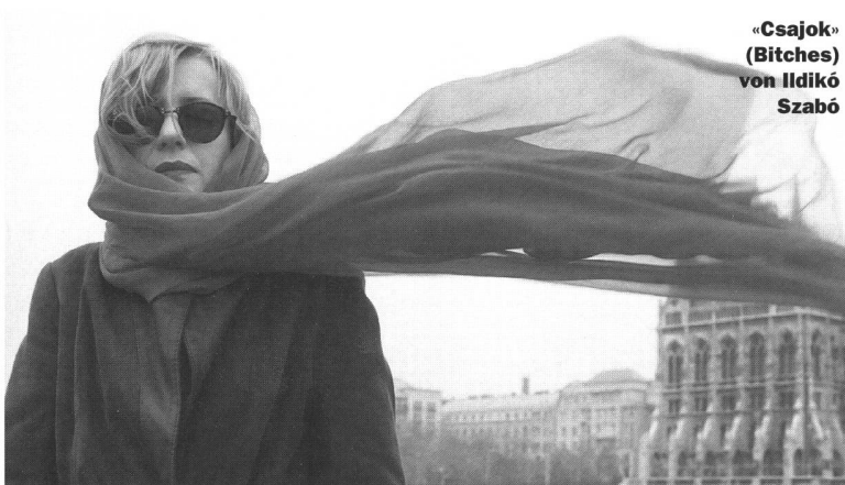
«Csajok» (Bitches) von Ildikó Szabó