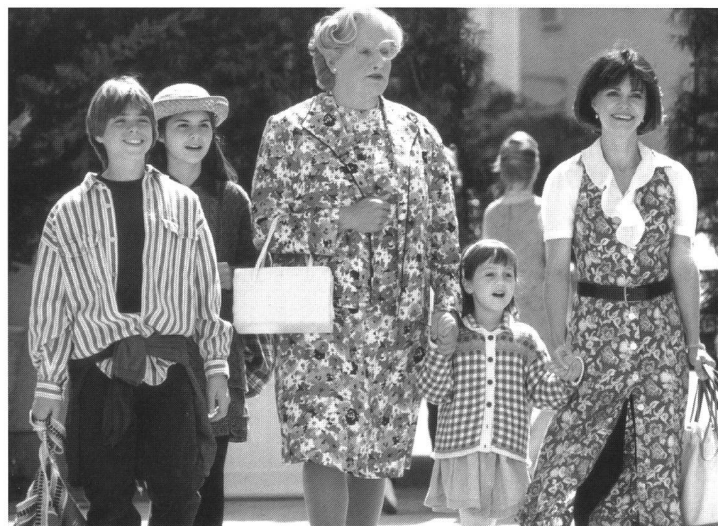
Entsorgter Daddy erhält die Chance zum Nachreifen: Robin Williams in « Mrs. Doubtfire » von Chris Columbus.

Sie sind im Kino definitiv out, jene Männer mit Prinzipien, die stets eingebunden sind in einen moralischen Rahmen, in dem sich Macht mit Pflicht versöhnt. Quasi symbolisch geopfert wurde dieser Typ am Schluss der « Star-Wars »-Trilogie, wo Luke Skywalker als Lichtgestalt seinen finsternen Vater tötet und durch diese ödipale Befreiungstat das Reich der Kinder aufrichtet. Seit den Siebzigern scheint – zumindest in den entsprechenden Unterhaltungsfilmen – die Familienwelt heil, nämlich befreit von den patriarchalen Unholden, die den Kinderchen so grauslich mit Beschneidung drohen. Es war vor allem Steven Spielberg, der zwischen Plüschlöwen und Teddybären den unbefangenen Kinderblick zelebrierte;