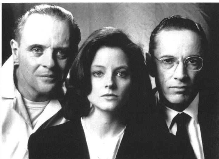
Frau (Jody Foster) mit janusköpfiger Vaterfigur (Anthony Hopkins und Scott Glenn) in Jonathan Demmes « The Silence of the Lambs ».