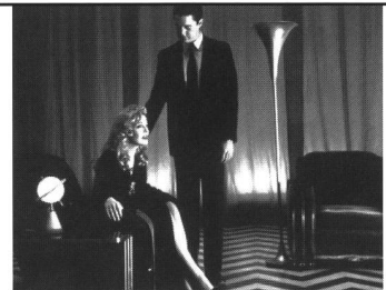
Spaltung der kollektiven Vater-Imago in David Lynchs « Twin Peaks ».

«Was ich vom Leben erwarte? Zu Hause bleiben, meine Frau flachmachen und mit den Jungs spielen.» 2 Exakt diesem Motto folgt auch der Held aus « Mrs. Doubtfire » (Chris Columbus, 1993), ein Schauspieler, der anfänglich Cartoons seine Stimme leiht, aber nach dem Verlust des Jobs gezwungen ist, sein kindlich-chaotisches Temperament zu Hause mit dem eigenen Nachwuchs auszuleben. Allerdings geht das der Frau schliesslich über die Hutschnur, und so kippt sie ihr grösstes Spielkind aus dem Nestchen. In Gestalt einer ältlichen Bediensteten kehrt der entsorgte Daddy jedoch in seinen Haushalt zurück und erhält da die Chance, ein bisschen nachzureifen. Ebenfalls verwandt mit Jacks Vater ist der gealterte Peter Pan aus Steven Spielbergs « Hook » (1991), der die Unbeschwertheit und Weite von neverland vergessen hat, sodass er nun seine eigenen Sprösslinge nicht mehr versteht. Um dem abzuhelfen, muss er zurück in jene Welt jenseits des Realitätsprinzips, zurück in den Jungbrunnen von Nimmerland, wo sich dann die Verknöcherungen der Erwachsenenrolle langsam lösen. Auffällig im übrigen, dass die Hauptfigur in beiden Filmen von Robin Williams verkörpert wurde, der spätestens seit seinem