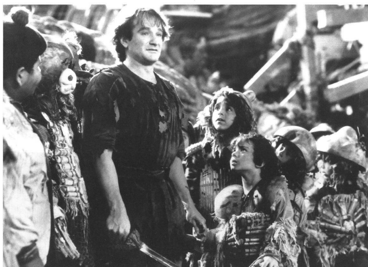
Robin Williams in Steven Spielbergs « Hook » auf der Suche nach dem Kind in sich.