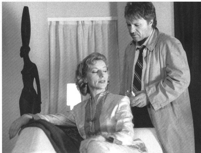
Betätigungsfeld für Schweizer Regisseure im Ausland: Eurocops «Die Falle» von Samir

Frappante Unterschiede bestehen allerdings im Bereich der Sprachregionen – oder, rundfunkmässig gesprochen, im Bereich der einzelnen SRG-Unternehmens-einheiten. Eine Untersuchung der Fernsehfiktion in der Schweiz durch das Forschungsunternehmen Acamedia hat vor kurzem ergeben, dass der Anteil fiktionaler Programmsparten in der Westschweiz wesentlich höher liegt als in der Deutschschweiz – sowohl im Bereich der Programmeinkäufe (Serien, Fernsehfilme, Kinospielefilme) wie im Bereich der Eigenproduktionen. Auch das hat