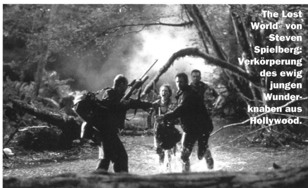
«The Lost World» von Steven Spielberg: Verkörperung des ewig jungen Wunderknaben aus Hollywood.

Nirgends setzt sich die Jugendkultur so deutlich blieben die Stars ewig jung bis in den Tod. Texte durch wie im amerikanischen Film. Am liebsten zu einem unlösbaren Paradox im nächsten ZOOM.