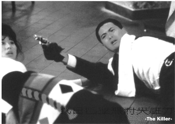
若要大家看完後有共鳴，

Und sicherlich ist es Wong und seinem Kameramann Christopher Doyle zu verdanken, dass alle young-hoods -Filmer mit der Handkamera rausgehen auf die Hinterhöfe, Spiel-, Sport- und Schulplätze, in die Enge der Sozialbauten, raus in den Neon-Dschungel der nächtlichen Metropole, kurz: dass man in den Filmen endlich etwas sieht von dieser unglaublich faszinierenden Stadt! (Bezeichnenderweise werden bei den Ausflügen der Hung-Hing-Boys andere Städte wie Taipei, Macau oder Amsterdam so beiläufig, anonym und austauschbar abgelichtet wie Hongkong bislang in den heimischen Produktionen.) Aber das ist meist nur pittoreske Sozialfassade ohne politisches Potential. Es fehlt der Biss eines Lawrence Ah Mon, der mit seinem Laienspiel «Gangs» schon 1988 den ganzen Trend vorwegnahm, dabei aber quasi-dokumentarisch so rigoros vorging, dass sich das niemand (bis auf ein paar Cineasten im Westen) ansehen wollte. Und im Vergleich zur mörderischen Konsequenz, die ebenfalls 1988 Ringo Lams «School on Fire» gleich 36 Schnitte von der Zensurbehörde einbrachte, sind die young hoods movies brave Klassenarbeiten.