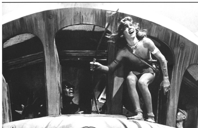
«Jungle 2 Jungle»

Eine Folge des verstärkten US-Engagements im Euromarkt könnte eine Verteuerung der Produktions- und Werbekosten sein. Wie die unabhängigen, aber finanzschwachen europäischen Produzenten unter diesen verschärften Bedingungen weiterarbeiten, und ob nicht die besten Talente langfristig alle bei den grossen Studios landen werden, wird sich zeigen. Eines allerdings lässt sich jetzt schon sagen: Die Expansionsstrategie der Hollywood-Studios wird in Europa Spuren hinterlassen. ■