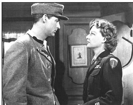
«I Was a Male War Bride»