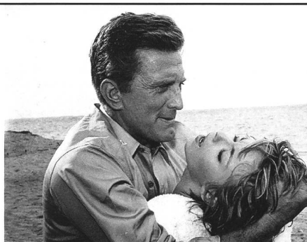
«In Harm's Way»