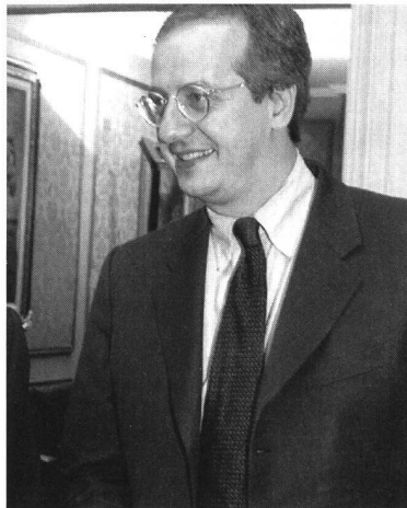
Stellvertretender Ministerpräsident und Hoffnung des italienischen Kinos: Walter Veltroni

Von einer sinnvollen Kulturpolitik konnte vor dem Amtsantritt des Hoffnungsträgers Veltroni keine Rede sein. Das Kulturgüterministerium war eine