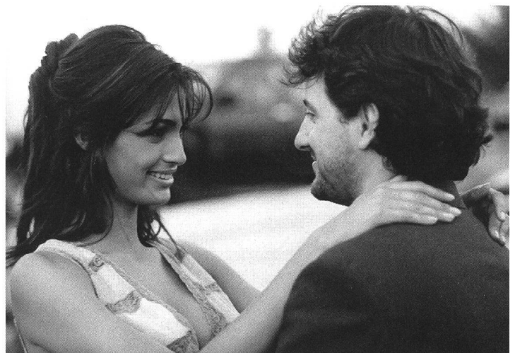
Nationale Produktion überflügelt Filme von US-Majors: « Il ciclone »

Die Ära Berlusconi, der Italien als Staatsoberhaupt und Medienmogul sukzessive in eine Telekratie umzuwandeln suchte, hat einen Teil der Bevölkerung aufgeschreckt. Doch von einem Sender wie Channel 4 in Grossbritannien kann man in unserem südlichen Nachbarland nach wie vor bloss träumen. Die Investitionen italienischer TV-Anstalten in die Produktion von fiktionalen Filmen waren, im Vergleich mit Fernsehstationen anderer Länder, bislang geradezu lächerlich bescheiden. Ohne Fernsehgelder läuft aber in Sachen Kinofilm in Europa längst nichts mehr. Nun sollen die