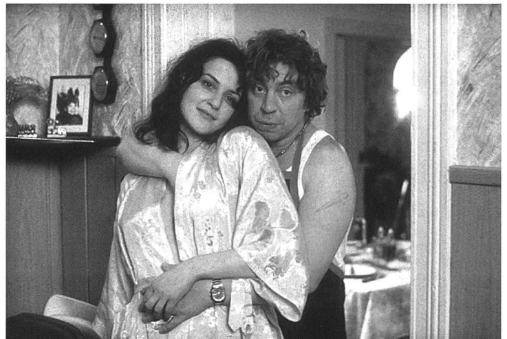
Bemerkenswerte Ausnahme: «Das Leben ist eine Baustelle»

laufen sehen? In Sherry Hormans «Irren ist männlich» wird Alkohol gar in jenen braunen Papiertüten verkauft, wie sie in den USA obligatorisch, hier aber nur aus «Columbo» bekannt sind.