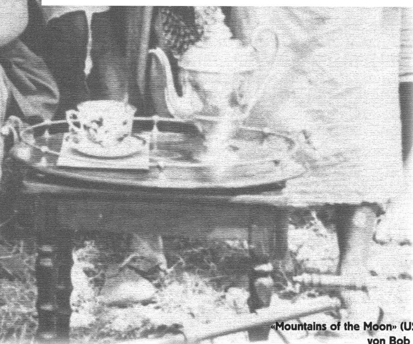
«Mountains of the Moon» (USA 1989) von Bob Rafelson