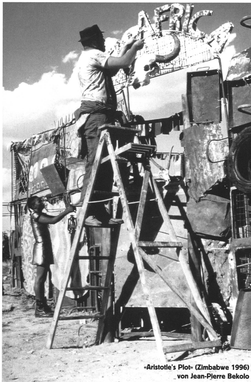
«Aristotle's Plot» (Zimbabwe 1996) von Jean-Pierre Bekolo