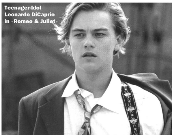
Teenager-Idol Leonardo DiCaprio in «Romeo & Juliet»

Häufigkeit, mit der diese Altersgruppe ins Kino ging, seit 1987 stetig zurückgegangen, so steigt sie jetzt wieder. 48 Prozent der 12- bis 17jährigen geben an, mindestens einmal im Monat ein Filmtheater zu besuchen. Für den Rest der Bevölkerung liegt der Anteil nur bei 26 Prozent. Sie sind aus dem Fernsehalter herausgewachsen, die Kinder der baby boomers . Und gleichzeitig werden ihre Eltern, die im letzten Jahrzehnt die Kinos bevölkert haben, des Ausgehens müde. Man hat überdies ausgerechnet, dass die Gesamtzahl der amerikanischen Teenager bis zum Jahr 2005 auf 55 Millionen steigen wird – genug, um einen für sie massgeschneiderten Film zum Erfolg zu machen.