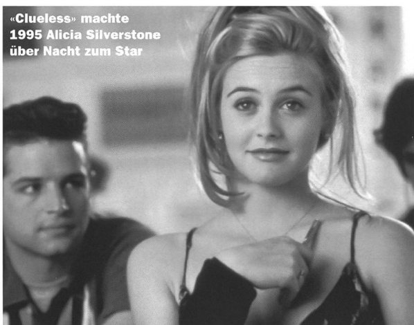
«Clueless» machte 1995 Alicia Silverstone über Nacht zum Star

Die Aussichten auf einen neuen Publikumskreis stimulieren Hollywoods Produzenten. Solange die neuen jungen Stars noch billig zu haben sind und solange der Geschmack ihrer Verehrer durch Fernsehgewohnheiten beeinflusst ist, haben die Studios gute Aussichten, vergleichsweise