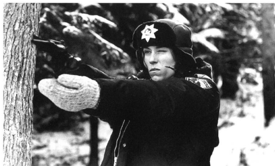
Kultfilm? Frances McDormand in «Fargo»

Allem und jedem wird heute Kultstatus zugesprochen. Kult ist zu einem Schlagwort verkommen, mit dem versucht wird, Erfolg geradezu herbeizureden: Kultautor, Kultschauspie-