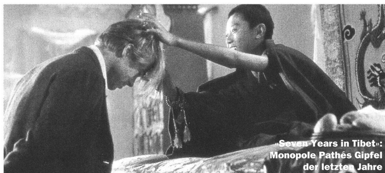
«Seven Years in Tibet»: Monopole Pathés Gipfel der letzten Jahre