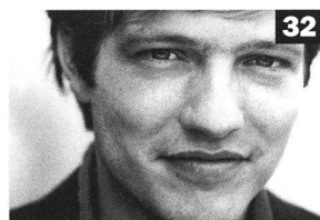
Interview mit Regisseur Thomas Vinterberg