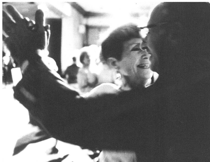
Emotional aufwühlendes Dokument wider das Vergessen: Stefan Schwieterts «Im Warteraum Gottes»

Während der Dokumentarfilm eine ungebrochene Vitalität aufweist, fehlt es dem Spielfilm offenbar an zündenden Ideen. Das dürfte verschiedene Ursachen haben: mangelnde Kreativität, fehlende Finanzen, eine verfehlt Filmförderungs-politik, Zwänge des Fernsehens, ohne das beim Spielfilm fast nichts mehr läuft. Auf Filme, die bereits in den Kinos zu sehen waren, etwa Fredi M. Murers «Vollmond» , hat ZOOM bereits hingewiesen. Über zwei der interessanteren Beiträge, Simon Aebys «Three Below Zero» und Tomi Streiffs «Die Hochzeitskuh» , ist im Bericht über das Filmfestival Saarbrücken (Seite 43) zu lesen. Thomas Imbodens unterhaltsamer, aber etwas klischeehafter Film «Frau Rettich, die Czerni und ich» ist bereits auf Video erschienen (ZOOM 1/99), und mit Filmen, die später ins Kino kommen, wird sich ZOOM zu gegebener Zeit auseinandersetzen, in der nächsten Nummer beispielsweise mit Dani Levis «The Giraffe» (Meschugge). ■