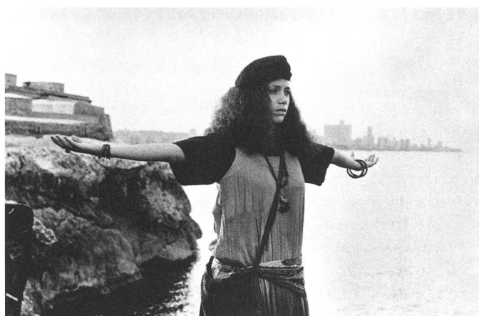
lat Grenzen des politisch Zulässigen neu definiert: «Fresa y chocolate» von Tomás Gutiérrez Alea und Juan Carlos Tabío