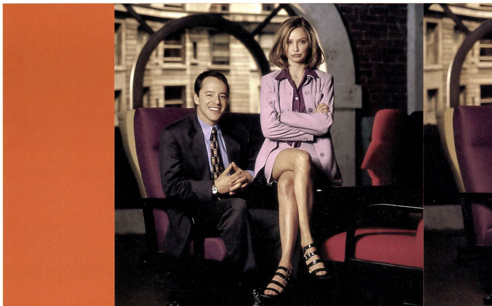
Mal mit Traummann, meistens aber ohne: In der intelligenten Anwaltsserie «Ally McBeal» verarbeitet Calista Flockhart ihre Alltagsorgen vor Gericht.

Auch an den Serien, der ureigensten Gattung des Fernsehens, lässt sich ablesen, wie sehr es zu persönlichen, alltagsgebundenen Stoffen tendiert. Griff man in den Anfängen eher auf die mythischen Figuren Hollywoods als Serienhelden wie Cowboys oder Geheimagenten zurück, so spielen neuere Serien in alltäglicheren Umfeldern wie Krankenhäusern oder Anwaltskanzleien. David Lynchs TV-Serie «Twin Peaks» wurde gefeiert, weil dort biederes Kleinstadtleben eine übersinnliche, paranormale Qualität bekam, für die der Regisseur entsprechende Bilder fand. Gegenwärtig bildet «Ally McBeal» die Speerspitze intelligenter Serienkunst; eine Serie über allesamt etwas neurotische Menschen, die in einer Anwaltskanzlei arbeiten. In einer gelungenen Verbindung von Leben und Arbeit lassen die Figuren ihre Alltagsorgen jeweils direkt in die Plädoyers vor Gericht