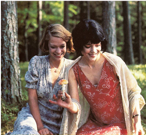
Heike Makatsch und Jasmin Tabatabai sind die weiblichen Stars in Xavier Kollers «Gripsholm». Der Film ist eine so genannt «minoritäre» Koproduktion der Schweiz mit Deutschland. Mehr zu den boomenden Produktionsallianzen ab Seite 14.