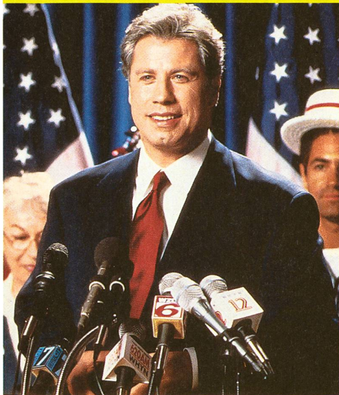
John Travolta als Präsidentschaftskandidat in Mike Nichols' «Primary Colors» (1998).