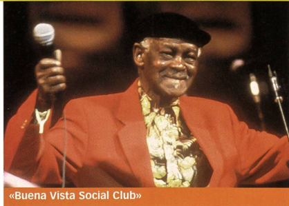
«Buena Vista Social Club»

« L'été de Kijujiro » («Kijujiro No Natsu») de et avec Takeshi Kitano, (Japon) Quand un bon à rien (Kitano) part au bord de la mer avec un enfant orphelin, le petit voyage se transforme en initiation... pour tous les deux! Une comédie mélancolique du maître de «Hana-Bi».