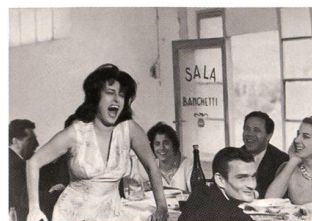
Anna Magnani dans «Mama Roma»

Anna Magnani, la superbe actrice de « Mamma Roma », de « L'homme à la peau de serpent » (« The Fugitive Kind ») et de « La rose tatouée » (« The Rose Tattoo »), parmi bien d'autres chefs-d'œuvre, est à l'affiche du Théâtre de l'Arsenic, à Lausanne. La