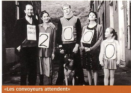
«Les convoyeurs attendent»