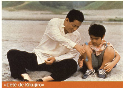
«L'été de Kijujiro»