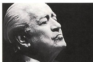
«Le jardin de Celibidache»