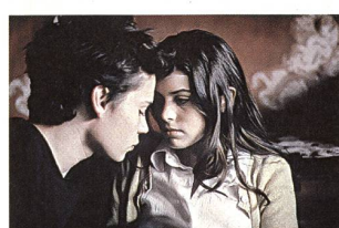
«Les mauvaises fréquentations»

Ph. Oswald SA Menuiserie / agencements intérieurs CH-8154 Oberglatt ZH Gamme BSA Tél. 01-850 40 74 Fax. 01-850 40 74