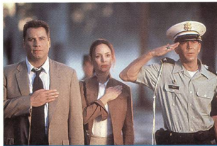
«Le déshonneur d'Elisabeth Campbell»