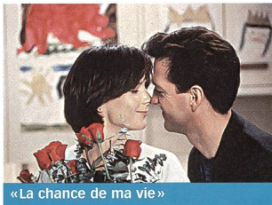
«La chance de ma vie»