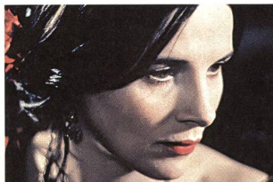
«Les enfants du siècle»