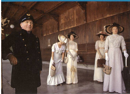
Figurants sur le quai de Griessen-See

Une rétrospective consacrée à Robert De Niro par Passion Cinéma, ainsi que la sortie de son dernier film, «Mafia blues» («Analyze This»), nous permet de revenir sur la carrière de cet acteur qui est devenu un mythe dans l'imaginaire du public.