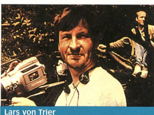
Lars von Trier

dont pourraient se réclamer les filles faciles peuplant le cinéma de Wong Kar Wai.