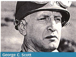
George C. Scott