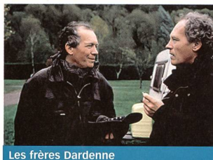
Les frères Dardenne