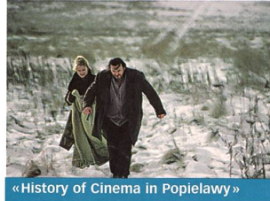
«History of Cinema in Popielawy»