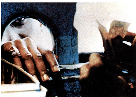
Haut: «Chitra nadir pape» (La rivière Chitra coule tranquillement) de Mokammel Tanvir, Bangladesh, 1999