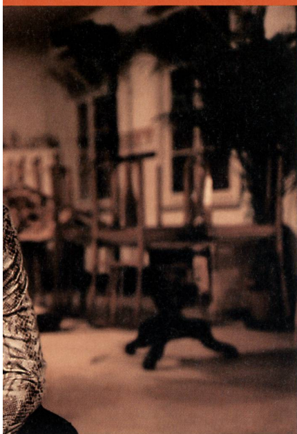
« Les saveurs du printemps » de Nadia Farès