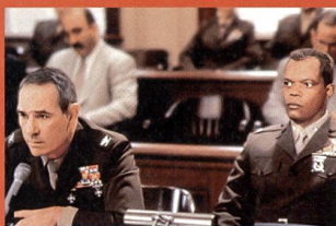
«L'enfer du devoir»

Avec Claudia Black, Radha Mitchell, Vin Diesel... (2000, USA - UIP). Durée 1 h 48. En salles le 13 septembre.