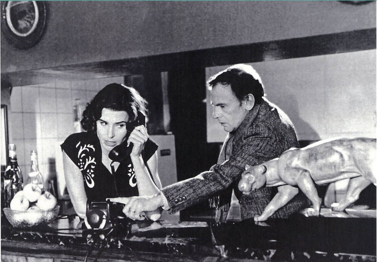
Barbara Becker (Fanny Ardant), la secrétaire de l'agent immobilier Julien Vercel (Jean-Louis Trintignant), mène l'enquête pour l'innocenter d'un double meurtre, dans «Vivement dimanche!»