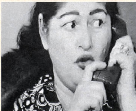
«Multiple Maniacs» de John Waters

Argos Project, Vevey. Du 23 septembre au 8 octobre. Renseignements: 021 921 50 79 et www.argos2000.ch .