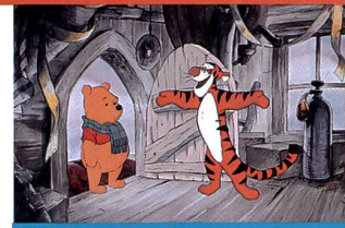
«Les aventures de Tigrou»

1. On entend par slasher le sous-genre du film d'horreur inauguré par «Halloween» (John Carpenter, 1978) où un tueur psychopathe assassine en série de jeunes adolescents d'une manière particulièrement brutale.