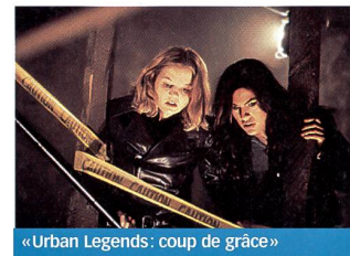
«Urban Legends: coup de grâce»