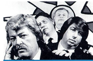
«Mais qui a tué Tano?»