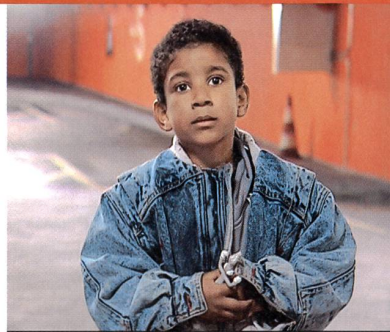
«L'arrivée» de Fernand Melgar

«La nuit du court métrage». Cinémathèque suisse, Lausanne, vendredi 20 octobre dès 20 h. Bleu Léopard, Lausanne, dimanche 8 octobre dès 20 h. Renseignements: 021 311 09 06.