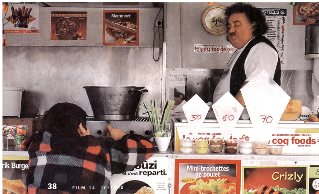
«La bouée» de Bruno Deville

CAC-Voltaire, Genève. Du 9 octobre au 29 octobre. Renseignements: 022 320 78 78.