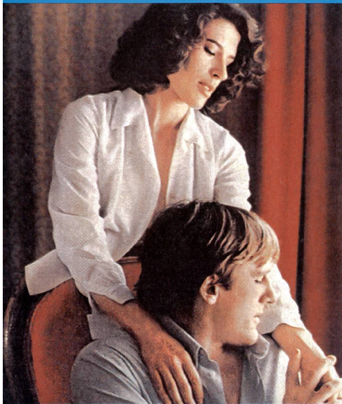
«La femme d'à côté» de Truffaut