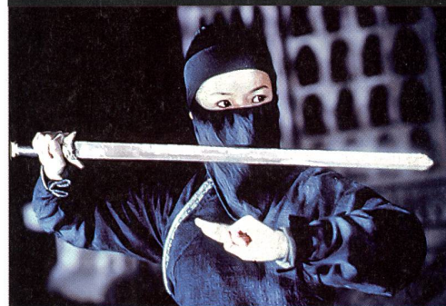
«Tigre et dragon» de Ang Lee

Le 6 octobre et jusqu'au lendemain matin, un large public pourra découvrir une anthologie des films à effets spéciaux. Le programme comprend des courts métrages signés Méliès (le père