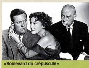
«Boulevard du crépuscule»

A Hollywood, un scénariste (William Holden) accepte l'hospitalité d'une an-