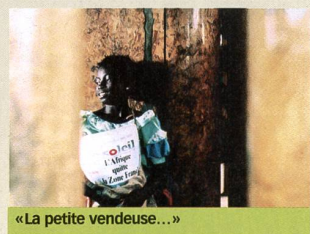
«La petite vendeuse...»

Vendredi 13 octobre, minuit et 0 h 45, TSR 2