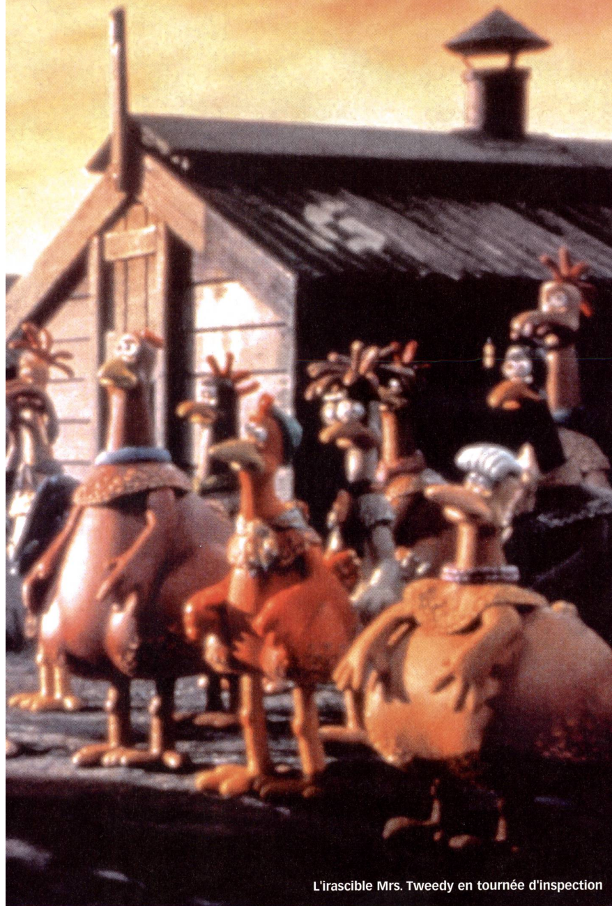
L'irascible Mrs. Tweedy en tournée d'inspection

« Chicken Run » de Nick Park et Peter Lord