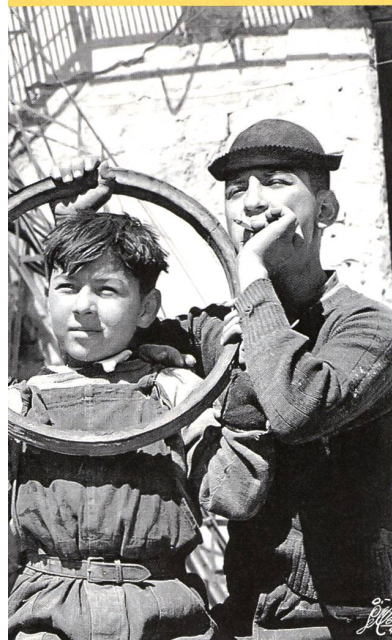
«Los Olvidados» (en français, les oubliés) de Luis Buñuel

dénominateur commun qu'on puisse leur attribuer réside dans une volonté collective de rompre avec le vieux système de représentation, dès lors que celui-ci n'est plus (ou n'a jamais été) en mesure de rendre compte de la réalité « présente » – sociale, politique, économique, psychologique, esthétique, etc.