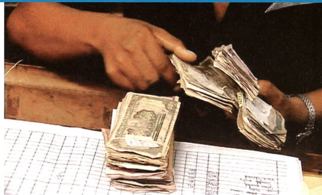
«Le profit et rien d'autre» de Raoul Peck

émission, les mêmes ingrédients et ressorts narratifs parce que c'est plus confortable – par paresse ou souci de l'audimat. A l'autre bout, il y a le «jamais vu» qu'on nous promet toujours, avec effets spéciaux à la clef... mais c'est en fin de compte décevant. A travers notre programmation documentaire, nous tentons d'organiser une pluralité d'expressions qui propose autre chose que ce déjà-vu; du nouveau qui ne prétende pas au sensationnel, mais qui entretienne les humains de l'humanité, de façon riche, complexe, unique.