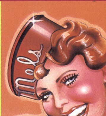
«American Graffiti» de George Lucas (1973)