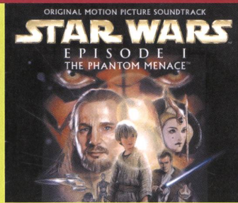
Musique composée par John Williams