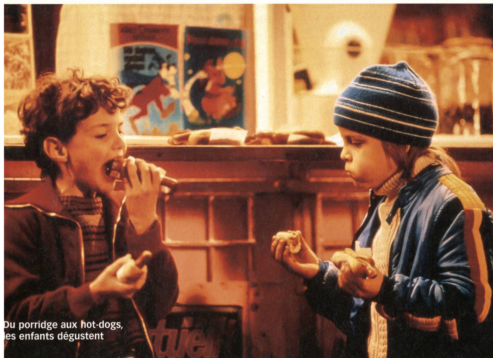
Du porridge aux hot-dogs, les enfants dégustent

C'est lorsque Elin et Agnès auront l'audace de s'affirmer, au risque de choquer leurs condisciples, que leur histoire pourra enfin commencer. C'est lorsque Elisabeth et les membres de la communauté Tillsammans auront le courage de partager leurs expériences divergentes qu'ils pourront envisager de vivre harmonieusement ensemble. La revendication par le cinéaste du droit à la différence sexuelle, toujours présente, échappe à toute réflexion convenue et va droit au but. Que demander de plus? Lukas Moodysson est l'un des cinéastes les plus intéressants et les plus vivifiants du moment. ■