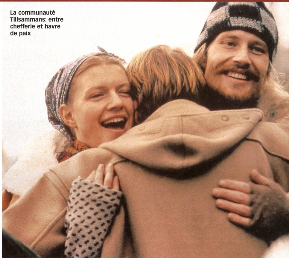
La communauté Tillsammans: entre chefferie et havre de paix