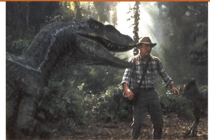
«Jurassic Park 3»

autres celui des geôliers. Rapidement, les matons abusent de leur pouvoir et la situation dégénère... Oliver Hirschbiegel s'est inspiré d'une recherche, minutieusement restituée, réalisée à l'Université de Stanford en 1971: après sept jours, on arrêta tout, tant les vingt hommes étaient devenus incontrôlables... (al) «Das Experiment». Avec Moritz Bleibtreu, Christian Berkel, Oliver Stokowski... (2001, Allemagne - Elite). Durée 2 h 00. En salles le 15 août.