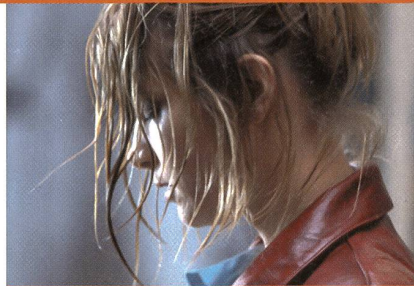
«Le baiser mortel du dragon»

«Planet of the Apes». Avec Marc Wahlberg, Helena Bonham Carter, Tim Roth... (2001, USA - Twentieth Century Fox). Durée 1 h 44. En salles le 22 août.