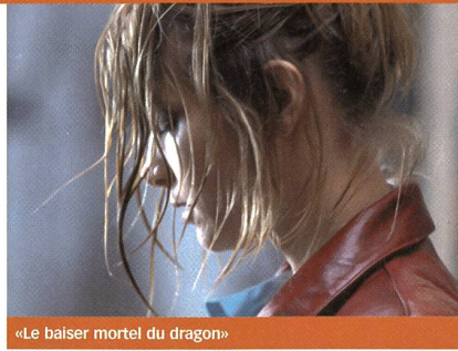
«Le baiser mortel du dragon»

«Planet of the Apes». Avec Marc Wahlberg, Helena Bonham Carter, Tim Roth... (2001, USA - Twentieth Century Fox). Durée 1 h 44. En salles le 22 août.