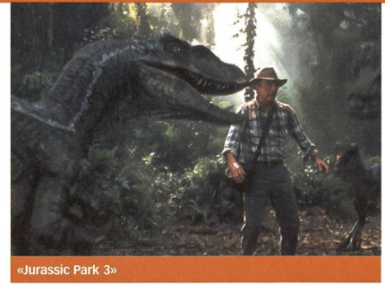
«Jurassic Park 3»

autres celui des geôliers. Rapidement, les matons abusent de leur pouvoir et la situation dégénère... Oliver Hirschbiegel s'est inspiré d'une recherche, minutieusement restituée, réalisée à l'Université de Stanford en 1971: après sept jours, on arrêta tout, tant les vingt hommes étaient devenus incontrôlables... (al)