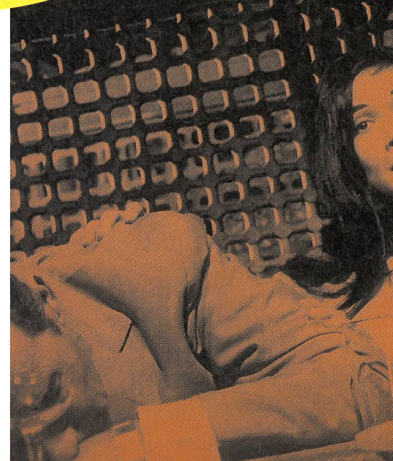
«The World of Suzie Wong» de Richard Quine (1960)

A coup sûr, les films les plus attendus de la rétrospective sont les moins connus. Comme déjà signalé ci-dessus,