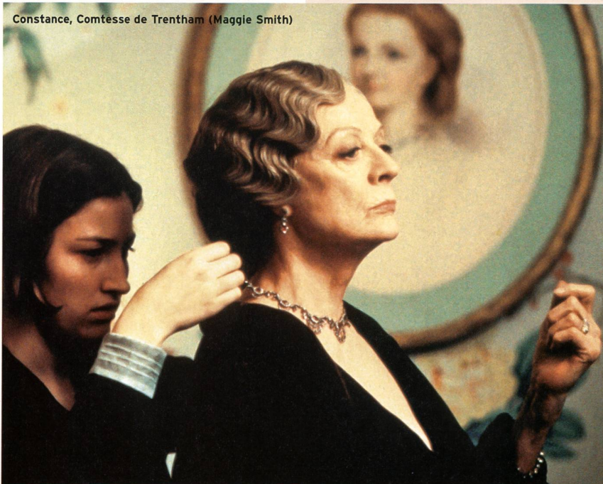
Constance, Comtesse de Trentham (Maggie Smith)

Un autre facteur qui explique le relatif anonymat de ce comédien irréprochable tient dans sa manière d'aborder les rôles. Agissant en véritable acteur de composition, il est souvent méconnaissable d'un film à l'autre, ce qui empêche le processus d'identification propre au star system . D'une sensualité quasi animale dans «Love» («Women in Love» de Ken Russel, 1969), où il brise le tabou de la nudité masculine, Bates peut se métamorphoser sans peine en petit employé arriviste dans «Tout ou rien» («Nothing But the Best» de Clive Donner, 1964), en Juif persécuté dans «L'homme de Kiev» («The Fixer» de John Frankenheimer, 1969) ou en médium terrorisé dans «La prophétie des ombres» («The Mothman Prophecies» de Mark Pellington, 2002), sa dernière prestation en date.