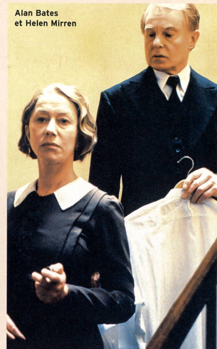
Alan Bates et Helen Mirren

Cet apparent dédain du star system trouve sans doute son origine dans les débuts de Bates. Formé à l'Académie royale d'art dramatique de Londres, il se fait