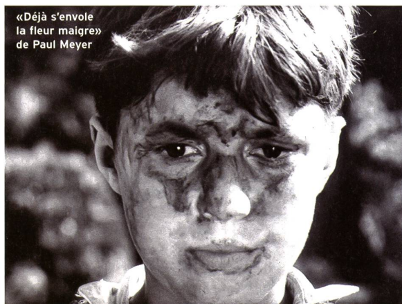
«Déjà s'envole la fleur maigre» de Paul Meyer

Jadis, Nord et Sud constituaient des critères plus ou moins pertinents pour qui voulait pointer les injustices. Aujourd'hui, cette géographie de l'inégalité a perdu de son exactitude.