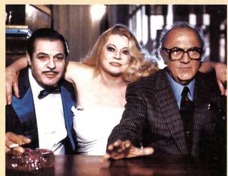
Marcello Mastroianni, Anita Ekberg et Federico Fellini