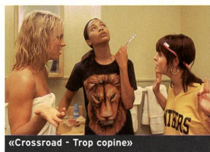
«Crossroad - Trop copines»