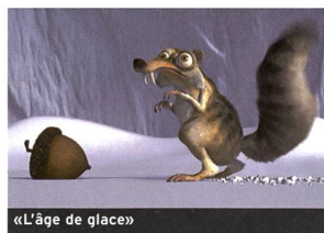
«L'âge de glace»

«We were soldiers». Avec Mel Gibson, Madeleine Stowe, Greg Kinnear... (2002, USA - Ascot Elite). Durée 2 h 19. En salles le 17 avril.