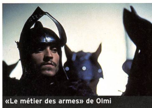
«Le métier des armes» de Olmi