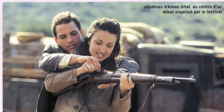
«Kedma» d'Amos Gitai, au centre d'un débat organisé par le festival