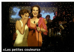
«Les petites couleurs»