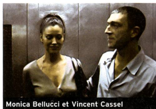
Monica Bellucci et Vincent Cassel