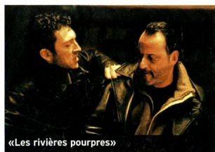
«Les rivières pourpres»