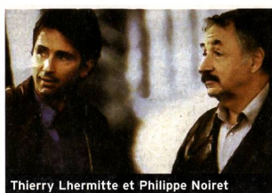
Thierry Lhermitte et Philippe Noiret