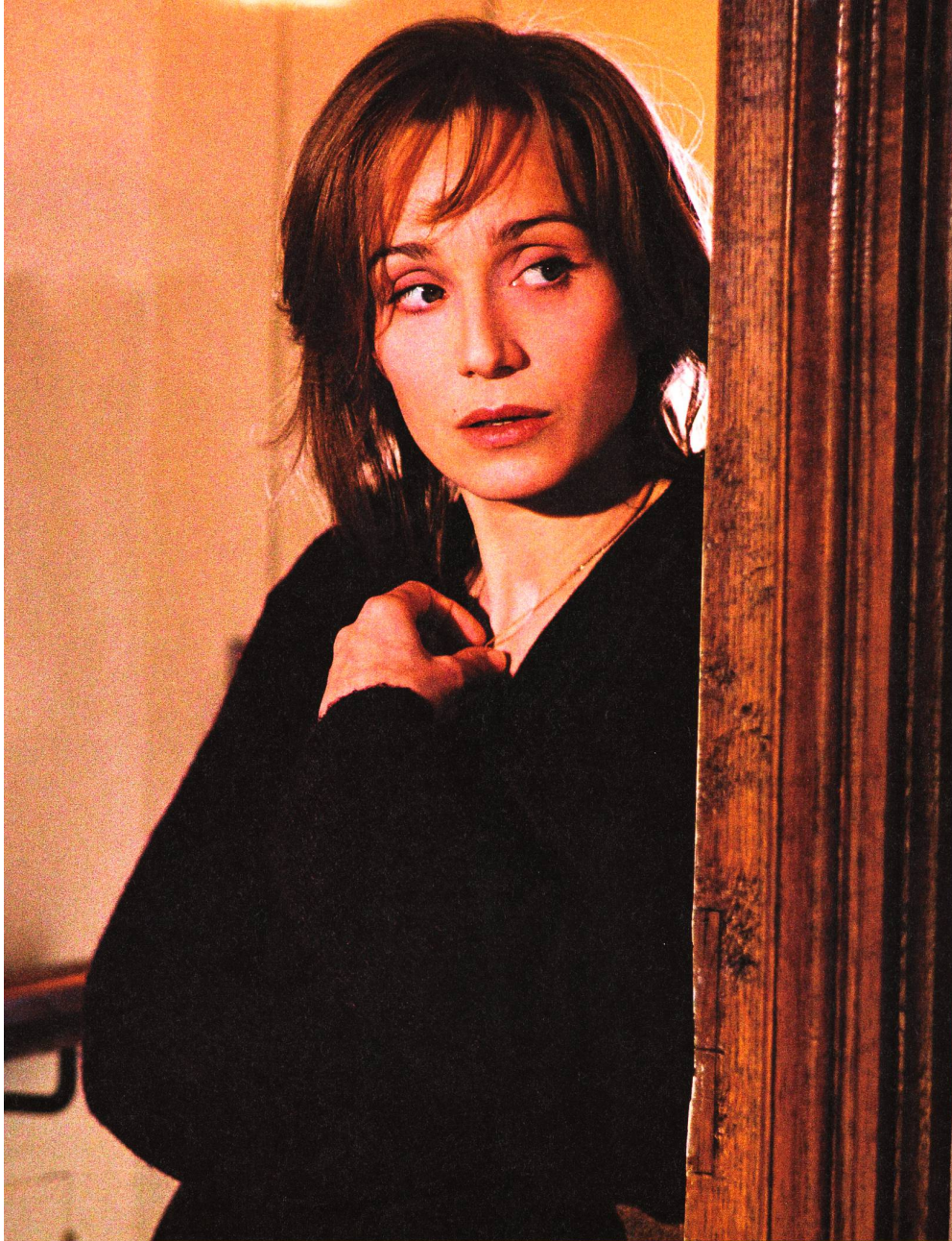
Kristin Scott Thomas dans «Petites coupures» de Pascal Bonitzer

fait assassiner des villageois bulgares à la frontière roumaine – un personnage d'une cruauté qui la marquera longtemps – elle y parle français, anglais, allemand et surtout... roumain!